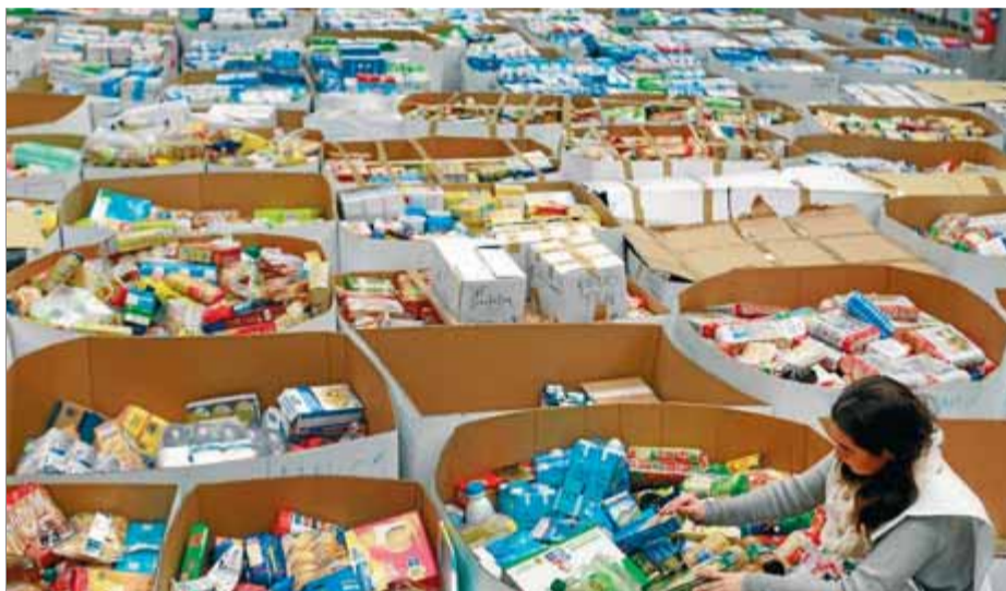
Aspecte general del banc dels aliments de Barcelona amb el menjar recollit el dia del Gran Recapte amb els contenidors on els ciutadans dipositaven els productes

xa aquesta iniciativa a mitjan 2011, quan un client de l'Estat li va proposar transportar menjar per als més necessitats després de quedar-se molt impactat per la imatge d'una família i els seus fills que buscaven menjar al carrer.