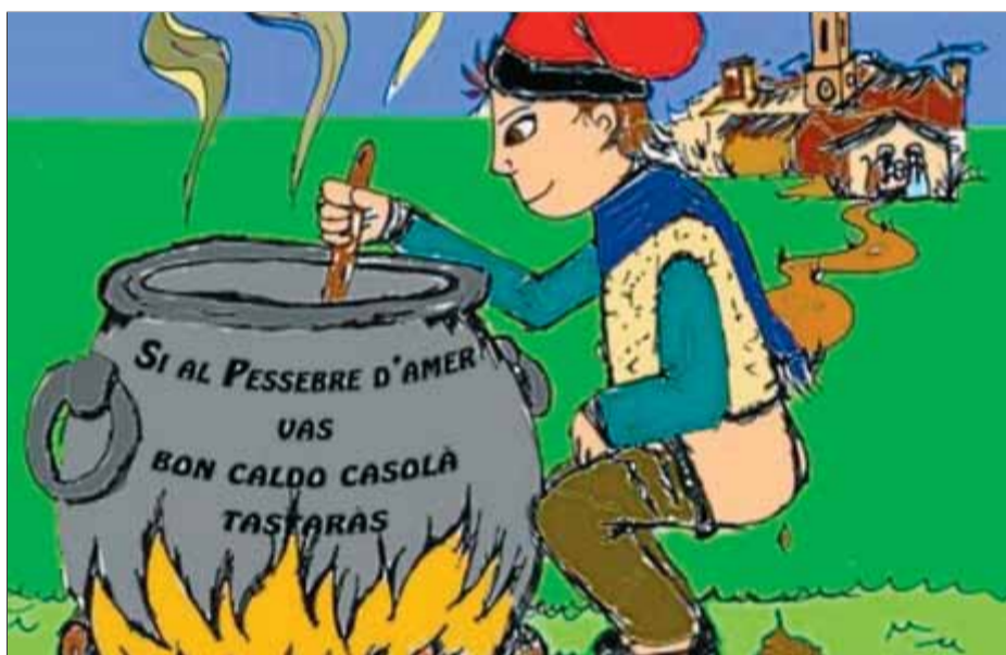
El cartell anunciador del pessebre vivent d'Amer és ben explícit ■ EL PUNT AVUI

Les entitats pessebrístiques locals han volgut reivindicar un futur digne per als desnonats i, per això, en la majoria de les mostres de diorames de la federació que els aplega