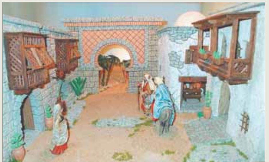
Segundo clasificado de dioramas en la 84 edición del Concurs de Pessebres.

Reus es una ciudad con una larga tradición belenista, cuyo concurso de belenes celebra este año su 85ª edición. La Secció Pessebrista de la Congregació Mariana, organizadora del evento, divide la competición en categorías en las que pueden participar tanto particulares como entidades, tiendas y escuelas.