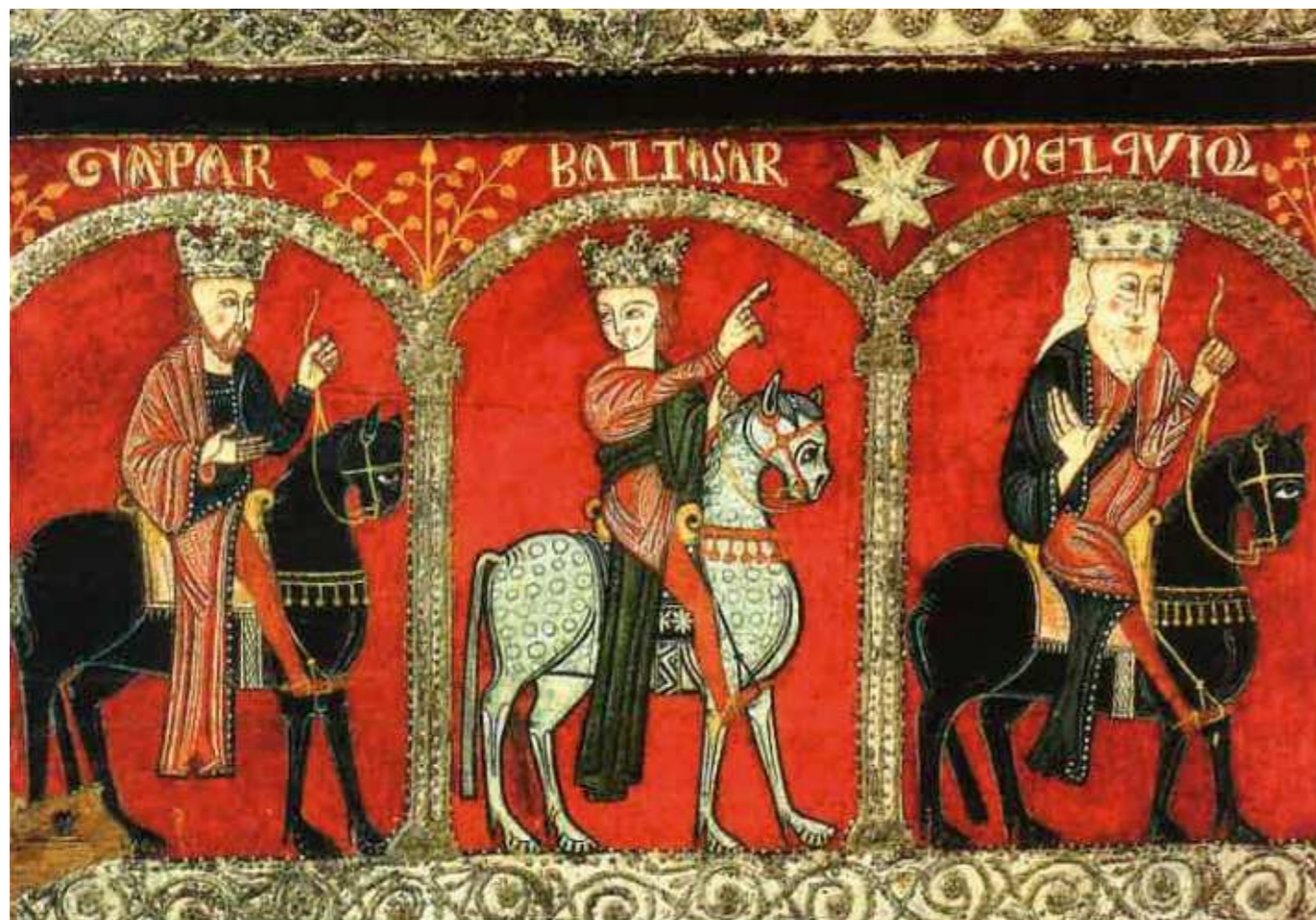
Els Mags guiats per l'estrella que assenyala Baltasar. Frontal romànic de l'església de Mossoll, Cerdanya

escrita, els que varen arribar tot seguit a la cova de Betlem guiats per un estel. Aquesta escenificació en forma d'estrella, mai falta en el pessebre tradicional popular català situant-la a sobre el portal de la cova. La primera representació d'aquest estel, pintat amb cua, és a l'obra de Giotto de 1304 dita l'Adoració dels Mags . No se sap del cert quina mena de fenomen celest va impulsar aquells personatges a posar-se en camí. Són diverses les hipòtesis per trobar una explicació científica a aquell fet que sols documenta l'evangeli de Mateu. La més acceptada, que sorgí resultat de la conjunció al desembre de dos planetes, Júpiter i Saturn, en la constel·lació dels Peixos. Un fet insòlit documentat ja en el segle VI a.C i repetit diverses altres vegades, una d'elles, el 17 de desembre de 1603 quan l'astrònom i matemàtic Johannes Kepler va documentar des de Praga amb el