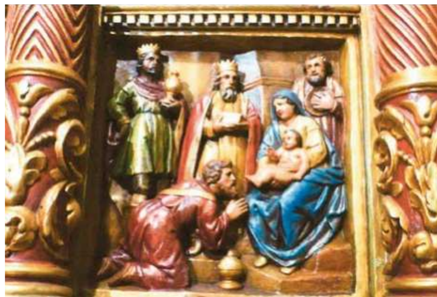
Adoració dels Mags. Retaule de la Mare de Déu de l'Avellana de la Sala de Vallmanya de Pinós, Obra de Joan Grau (1652)

No se sap qui foren aquells mags vinguts de terres llunyanes, Mesopotàmia o Pèrsia, llocs de civilització avançada, més rics i cultes en aquell moment que el petit país