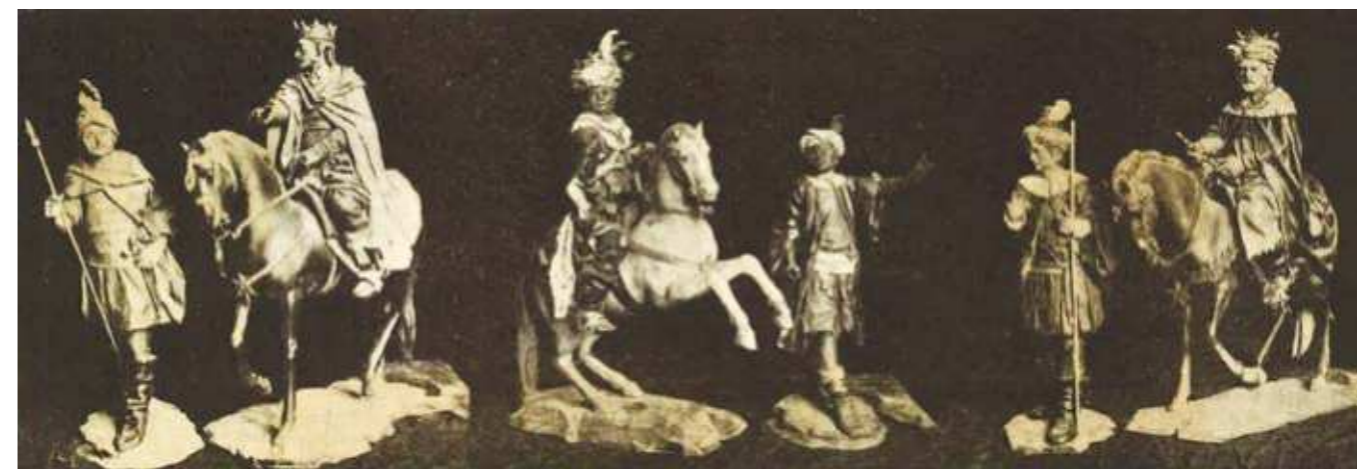
Figures populars antigues dels Reis de l'Orient per al pessebre