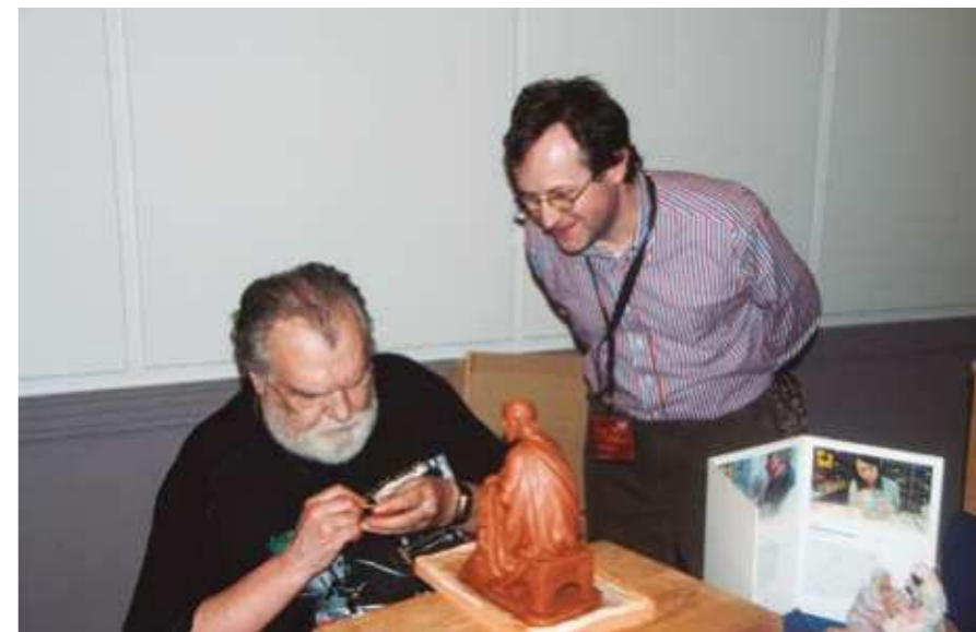
Simposi Internacional Sitges 2013.

Amb els Bertran ens coneixíem de sempre, ja de joves, i els nostres pares també es coneixien. Un dia em vaig trobar amb en Francesc Bertran i em va proposar d'anar a