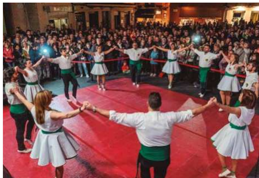
Acte inaugural a Manresa, plaça Major (16.03.2024). Grup sardanista Dintre el Bosc.

dotze van tocant ; i Dos minyons cap a Betlem / El Rabadà (2006).