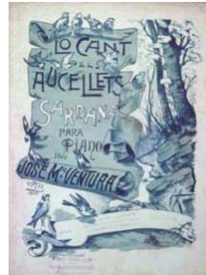
Portada de la partitura per a piano de la sardana Lo cant dels ausellets , de Josep M. Ventura i Casas

una referència especial a Lo cant dels ausellets 4 . Una de les primeres sardanes llargues que va escriure amb una gran senzillesa i emotivitat, seguint la melodia coneguda 5 . Sembla que Ventura no era recopilador de cançons antigues, per tant la finalitat d'introduir aquesta melodia hauria estat per ser una tonada que ja formava part de la memòria col·lectiva i podria atraure l'interès del públic.