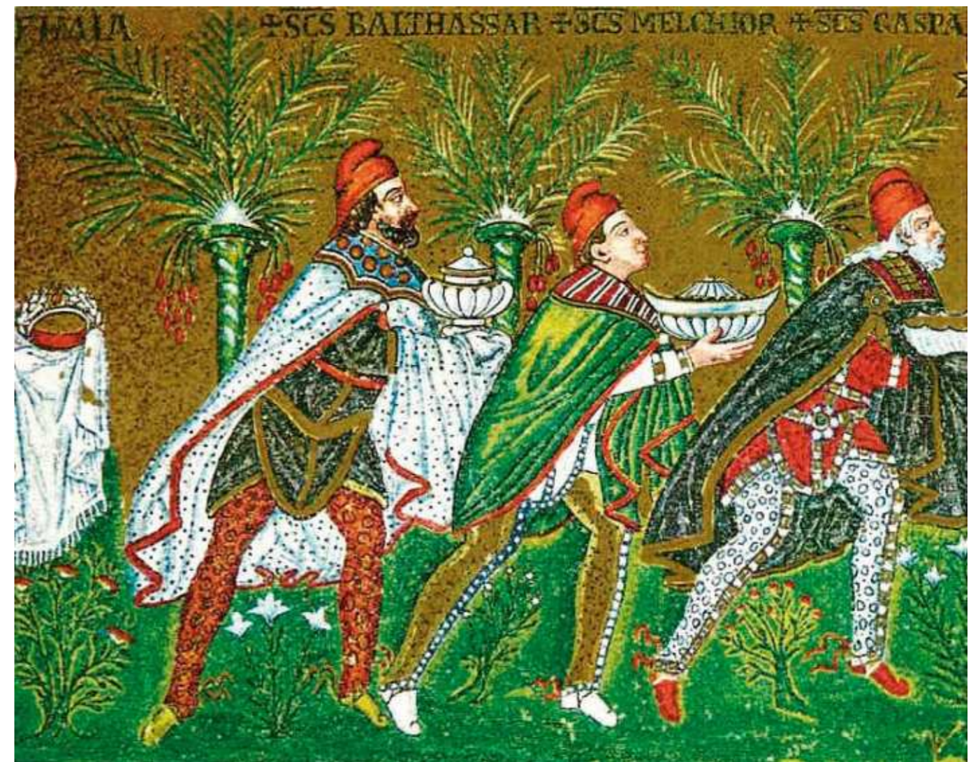
Els Reis Mags. Fragment dels mosaics del segle VIè de l'església de sant Apollinare Nuovo, a Ravenna, Itàlia

Aquests egregis Mags de classe social alta, després dels pastors, representació de personatges més humils, foren, segons tradició