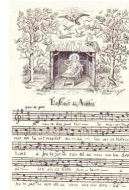
"Lo cant dels Ausells", en el Cançoner Popular d'Aureli Capmany

Capmany remarca que segurament l'hauria conegut per terres gironines, on sembla que es coneixia la versió i, en recordar-la, l'hauria tingut com a tema de la sardana. Malgrat aquest comen-